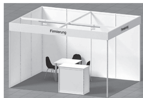
Beispiel-Bild eines Eckstandes