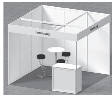
Beispiel-Bild eines Eckstandes